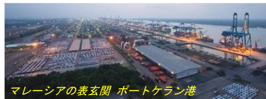
マレーシアの表玄関 ポートケラン港

今回25年振りに訪れたマレーシア。その予想以上の変貌ぶりに大変驚き、同時に、これからますます近隣諸国へ影響を与えながら、大きく発展するであろう同国市場を予感しました。