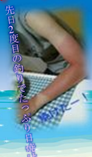
先日2度目の釣りでしたっぶり日曜時