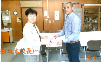
緑川小学校様(坂本校長)へ