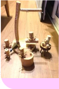
文・写真/戸田まなみ

この新聞が届く頃にはもう開催されているか、もしくは終わっている可能性もありますが、興味のある方はぜひ足を運んでみられてはいかがでしょうか？今回間に合わなければ次の春以降にでも・・・ 写真は私が好きなお店『まるたんぼう』さんの商品です。この手作り感がなんとも言えない…♡