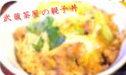
武蔵茶屋の親子丼

噛めば噛むほど鶏を主張する味の濃い肉。その地鶏肉をとじるのは濃厚でクリーミーな卵。これが絶妙に優しい味を醸し出す。一緒に卵にとじられたやや太めに切られたネギもいいアクセントになっている。