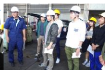
記念撮影！暑い中来て頂きありがとうございます！

見学に来られたことで、私達もまた貴重な時間を持つことが出来ました。ありがとうございました！