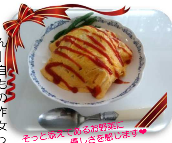
そっと添えてあるお野菜に優しさを感じます♡

夏休み終わり頃の金曜日、『お父さん明日お昼ご飯作ってあげようか♡?』と！えっ…一瞬何が起こったのか自問自答した私でしたが、よ〜く考えても手作りお菓子はハロウィンデーなどのついでにもらった事はあるが、食事を作ってもらったことはない。作ってる次女の姿も一度も見た事がない。いや！作った事自体ないはず！そーはいいっても、いままで一生懸命育てた親のありがたさが、少しずつわかってきたのでは…と思い、翌日お姉ちゃんに教えてもらいながら一生懸命作った、次女手作りのオムライス！とってもおいしくいただきました。しかも、なんと土曜・日曜続けてお昼ご飯を作ってくれました。最高でした！