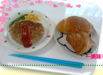
〜美味しくそうなハンバーグ(いゝ)♪♪ 文・写真/舞芳郎