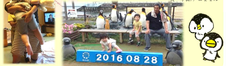
文・写真/戸田まなみ

今回の旅行は、父の誕生日のお祝いと震災で精神的に疲れきつていた両親を癒やす目的でした。何度も温泉に入りに行ったり、孫達と一緒に出かけることができ、楽しそうな顔を見て勝手に達成感に浸つております。たまには温泉旅行もいいものですね(*^^*)