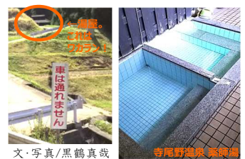
文・写真/黒鶴真哉

中は男女の別はあるものの、浴室と脱衣場は隔たりがない、ワンルームタイプ。いかにも共同浴場という風情。そこに湧く湯は、硫黄成分濃+透明度高の癒しの名泉。必ず道に迷うという特典付きですが、これか迎える暑い夏にはピッタリのぬるめの湯。お土産には、長時間取れない硫黄の香りは如何でしょうか・・・。