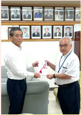
網田小学校 (佐伯校長) 様へ

地域の方々への恩返しを目的に始めた、小中学校への図書寄贈。本年度も無事に行うことが出来ましたので報告致します。通算16回目となった今回の図書寄贈先は、宇土市立網田小学校様と同市立網田中学校様でした。