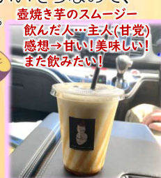
壺焼き芋のスムージー 飲んだ人…主人(甘党) 感想→甘い！美味しい！ また飲みたい！