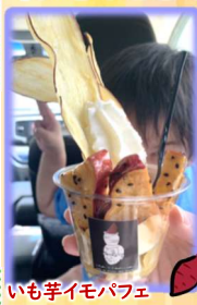
いも芋イモパフェ