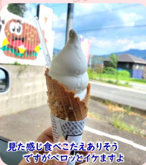
見た感じ食べたいえありそう ですがペロッとイケますよ