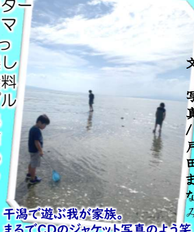
干潟で遊ぶ我が家族。 まるでCDのジャケット写真のよう笑