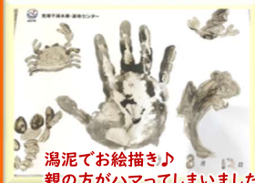
潟泥でお絵描き♪ 親の方がハマってしまいました◎

荒尾市にある南北約9.1kmに及び国内最大規模の干潟です。干潮時には沖の方まで歩いて行くことができます。また夕日がとてもきれいで、デートスポットにもなっているそうです。近くには荒尾干潟水鳥・湿地センターという施設あり、干潟に住む生き物の展示、マジック釣りの疑似体験、潟泥(かたどろ)を使ったお絵描き体験などがあり、時間を忘れて楽しむことができます。しかもこちらの施設、無料なんです！カップルでも家族連れでも楽しめて、お財布に優しいおすすめスポットでした♪