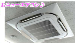
おニューエアコン

エアコンが故障して3日目。扇風機があるとはいえ、やはり暑い！暑すぎる！神様、助けてください！と心の中で叫んでいると私の思いが通じたのか取替工事をしてくださる業者の方が見つかりました。ありがたい！本当に感謝です。改めてエアコンの大事さを痛感した数日間でした。