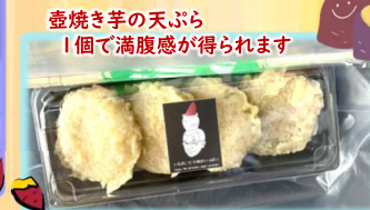
壺焼き芋のてんぷら 1個で満腹感が得られます