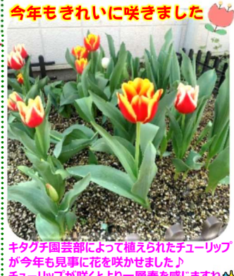
今年もきれいに咲きました キタグチ園芸部によって植えられたチューリップが今年も見事に花を咲かせました♪チューリップが咲くとより一層春を感じますね。