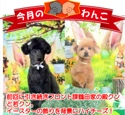
前回に引き続きフロント課鶴田家の殿クンと若クン。イースターの飾りを背景にハイチーズ！

本社：熊本市南区日吉2丁目11-40 TEL.096-357-8400 FAX.096-357-8495 工場：宇土市新開町字東開1895-19 TEL.0964-24-1400 FAX.0964-24-1500 定休日：土曜日・日曜日・祝日 営業時間：午前8時30分～午後5時30分