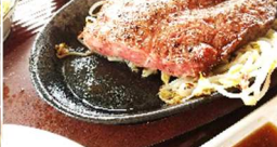
2024年上半期のベスト断面賞!!

もっと噛んでいたのに無くなるのが早い(笑)。 やわらかい・とろける・まるやか・甘くて旨い・程よい脂感、ステーキソースでも和風おろしダレでも塩コショウでも美味しくいただける。こいつはやべえヤツです...。ご褒美グルメがまた増えてしまいました(笑)。