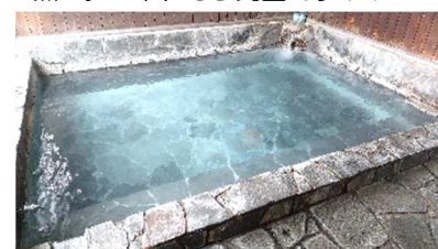
湯船右側、白く見えるのが沈殿した湯の花!!

熱いが故に、長いこと湯に浸かっていけないのが玉にキズですが、暑い日に熱い湯に入るとかえてスッキリする(^-^と、私は勝手に思っております。何でしょう、気化熱ってやつでしょうか... この夏は是非、ホテルの里温泉で熱々の硫黄泉を体感してみるのはいかがでしょうか。