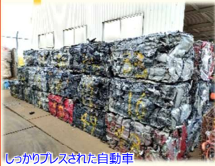
しっかりプレスされた自動車