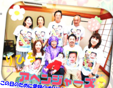
この日のために愛娘のオリジナルTシャツを作りました!

娘のお食い初めは卒寿を迎えた祖母にお願いしました。祖母に抱っこしてもらい赤飯を娘の口にちょんちょん(笑)これで一生食べる物に困ることはないでしょう! これからも健康で元気にすくすく育てほしいと強く願うパパなのでした。