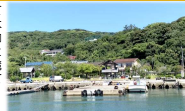
能古島(福岡市西区)

先日、毎年恒例の家族旅行に行ってきました。今回、旅行先に選んだのは福岡県福岡市にある能古島。福岡市内に島があるのか？あの都会の街に？と疑問が多かったのですが、島は博多湾内にあり名浜港からフェリーに乗って約10分で到着する近さで気軽に行ける島という事ですぐに納得しました。