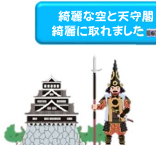
綺麗な空と天守閣 綺麗に取れました📷