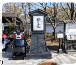
くまモンの人形焼き

人混みで少し疲れたけど、一日中、天気もよくて正月らしい外出でした。今年は娘の「初めて」にいくつ立ち会えるのかな？来年は一緒に歩いて回れるかな？なんて妻と話しながら帰路につきました。娘の「初めて」がまた一つ増えたとても良い一日でした。