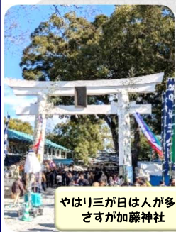
やはり三が日は人が多いが加藤神社