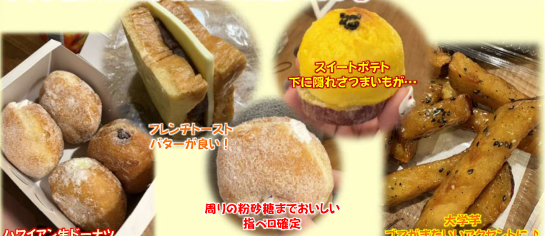
ハワイアン生ドーナツ

2026年もおいしいものをたくさん食べまくりたいと思いますので、今年も【食いしんぼ】をよろしくお願いします😊