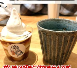
甘いもの好きにはたまらんです