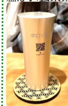
←量ばらばら少なめ生ビール

ほろ酔いの火照った体に冷たいソフトクリームが染み渡り、すっかり酔いもさめ、すっかりした気分で3軒目に行くことができました。みなさんも銀座通り付近で飲み会の際はぜひいかがでしょうか！